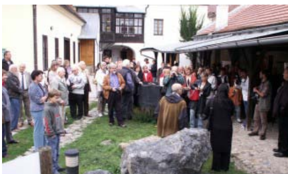
Ze zahájení výstavy.