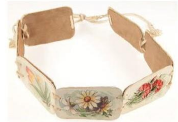
Dámský kožený opasek