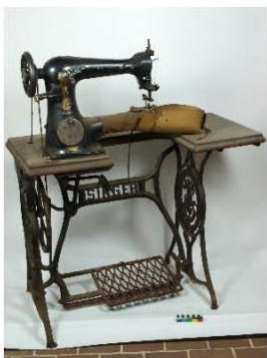
Obuvnický stroj Singer 18-2