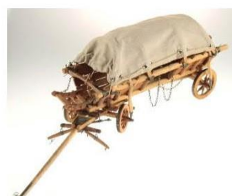
Detailní model selského vozu