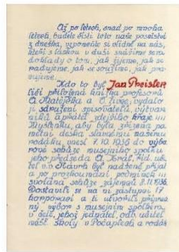
Část pamětního spisu