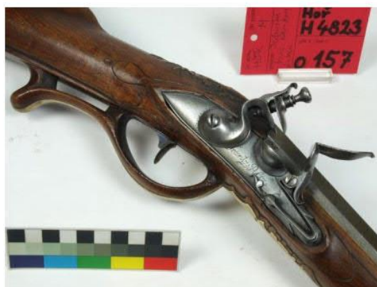
Jednuška s francouzským křesadlovým zámkem Hoř H 4823, před a po konzervaci (detail)