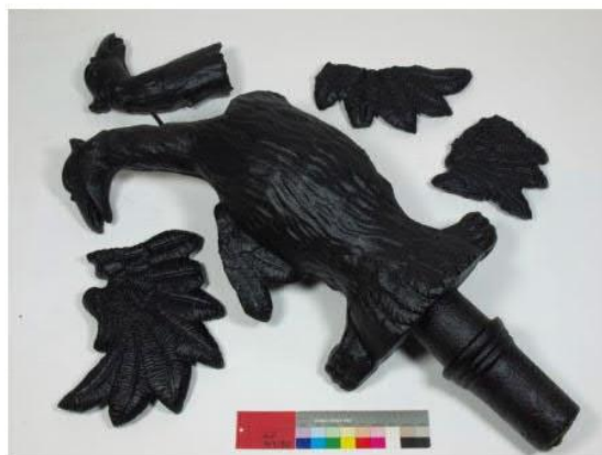
Litinový dvouhlavý orel Hoř 149/80, před a po konzervaci