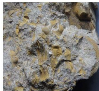
Kranidium – část trilobita