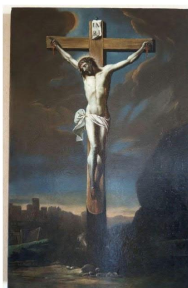
Olejomalba na plátně „Ukřižování“ VU 443, před a po restaurování