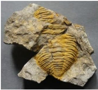
Exuvie (svlek) trilobita