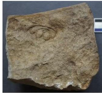
Bizarní ocasní štít trilobita