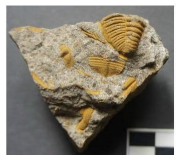
Exuvie (svlek) trilobita