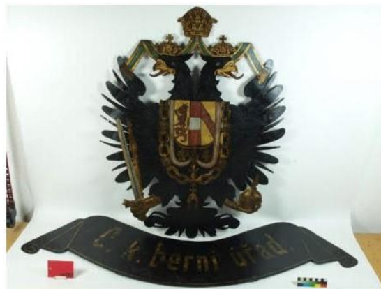
Plechový znak c.k. berního úřadu v Hořovicích sH 6109, před a po konzervaci

Poznámka: Barevnost předmětů na fotografiích před a po ošetření se může lišit.