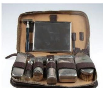
Pánská cestovní souprava