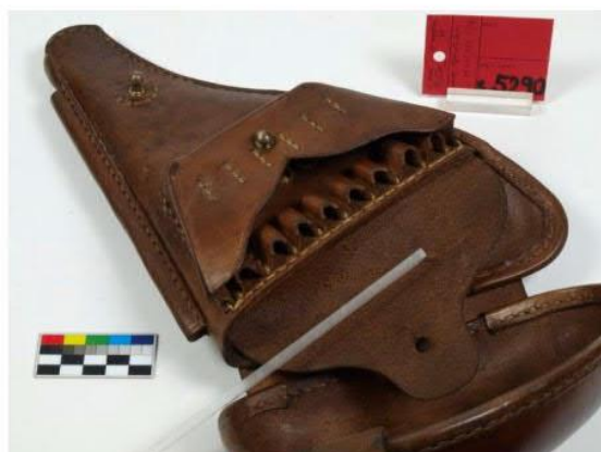
Kožené pouzdro na revolver s.5290, před a po konzervaci