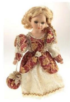
Replika historické panenky