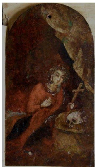
Olejomalba na plechu „Sv. Máří Magdalena“ N 33, před a po restaurování