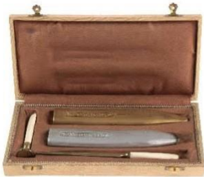
Sada na pečetění