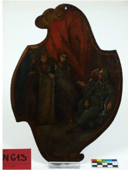
Olejomalba na plechu „Dvanáctiletý Ježíš v synagoze“ N 613, před a po restaurování