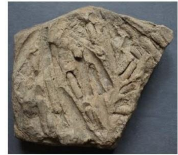
Výlitky trubicovitých tvarů